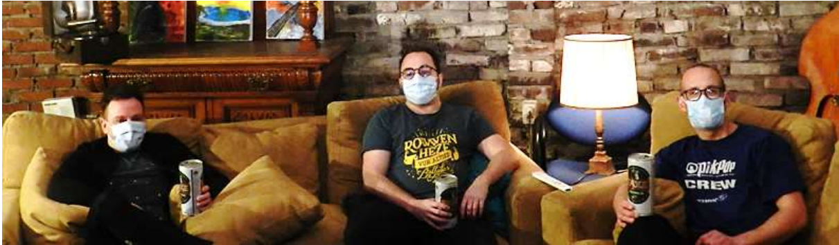
De Buurmannen, wat zal hun bijdrage zijn?

In het carnavalsweekend van 13 en 14 februari presenteren we op zaterdag en zondag een Youtube-uitzending. De voorbereidingen hiervoor zijn in volle gang. Wat je hierin te zien krijgt blijft nog even een verrassing. We verklappen al wel dat het een mix zal zijn van herinneringen en nieuwe en verrassende filmpjes.