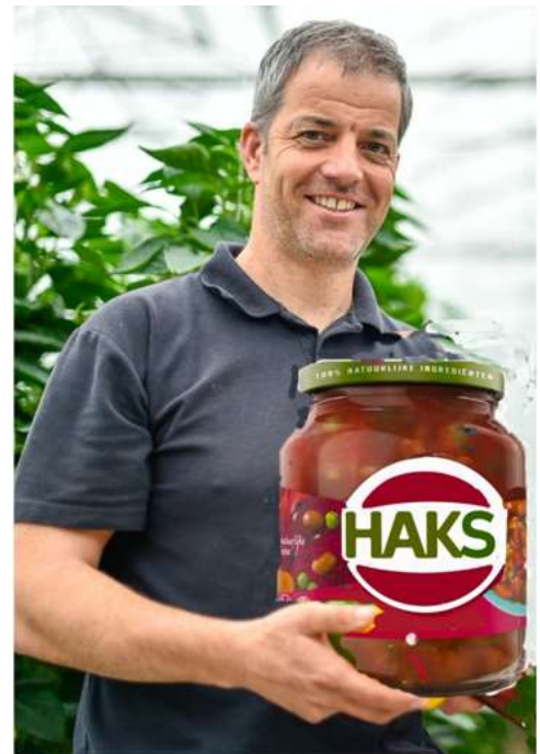
HAKS: Baeter good gejat aas slecht verzonne

Ik zeg: "Daat is en moei initiatief, jao. Ma, waat mot ik meej dao verder beej veurstelle?" "Ja", zet ie, "We brenge die oet onder ennen eige naam." Ik zeg: "Oh, uh, iets vaan ùh... ledereen is verzot, op Red Peppers paprika's uit pot? " "Neh", zet ie, en heej pekt zienen tillefoon oet de tès en lot meej en foto zeen vaan enne pot mit etiket. Ik zeg: " HAKS "? Heej zêt: "Ja...waat? Zoë kent os toch iederiën?" Ik zeg: "Liekt daat neet en bitje veul op daat andere bekende gruntemerk?" "Daat kaan waal zien," zet Red Pepper, "Ma os neume ze aal ïeuwe Haks en daan dao beej.... Baeter goot gejat, aas slecht verzonne, toch?"