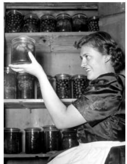
Kwaliteitscontrole: Alliën 100% is good genog