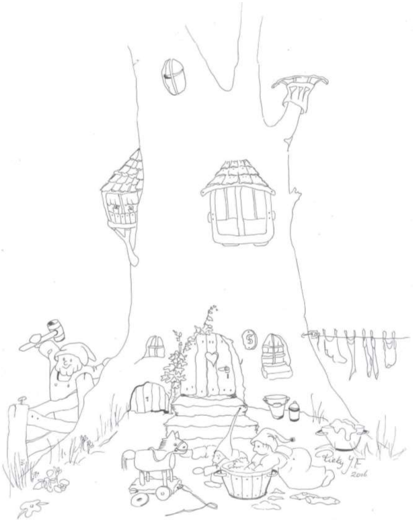
Getekend door Rieky Janssen-Franssen